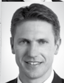
RA Dr. Zellhofer Eisenberger & Heitzog RA GmbH