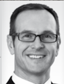
Mag. Lichtkoppler CONSPECTRA GmbH, CTE