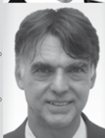
DDr. Wöber Bank Austria Creditanstalt AG