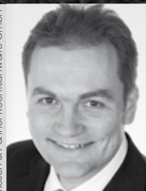
Sib Mag. Schützinger Orange Cosmos

14.-15. November 2012, Wien 22.-23. Mai 2013, Wien